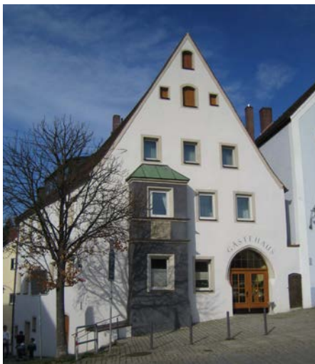
Fassadenerneuerung Gästehaus Bayerischer Hof, sanfte Sanierung des Seidel-Saals, Alte Lateinschule, Anwesen Schall,