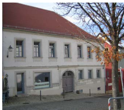
das Egloffstein'sche Palais durch die Stadt, in dem seit August 2008 das Stadtarchiv untergebracht ist, Frisör Minder und die Synagoge, die seit 2012 fertig ist.